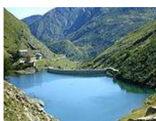
Lago di Malciaussia

Ci sono vari laghi nel territorio comunale, sia naturali che artificiali. Il più grande di questi ultimi è quello di Malciaussia, creato tra le due guerre quando venne costruita una diga per fare una centrale idroelettrica, sommergendo tra l'altro la vecchia frazione.