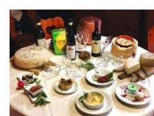
Prodotti tipici locali